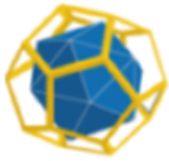
Liceo Amedeo di Savoia