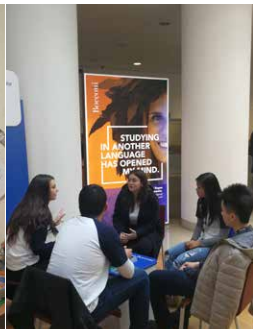
Confrontati con studenti che frequentano i corsi di tuo interesse